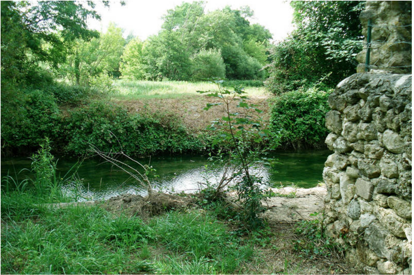
Emplacement de l'ancien lavoir