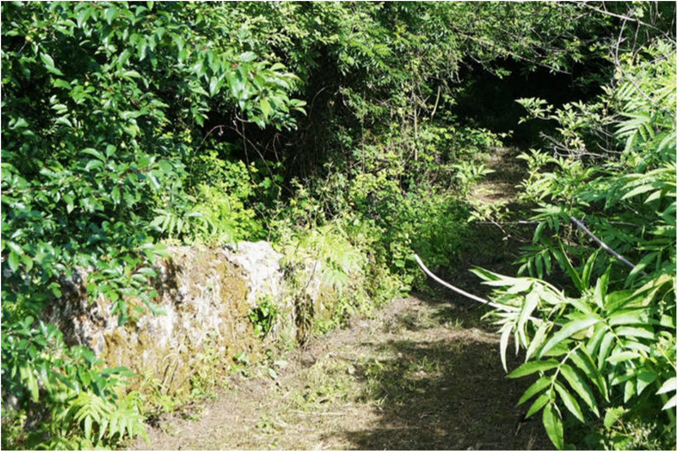
Début de la balade