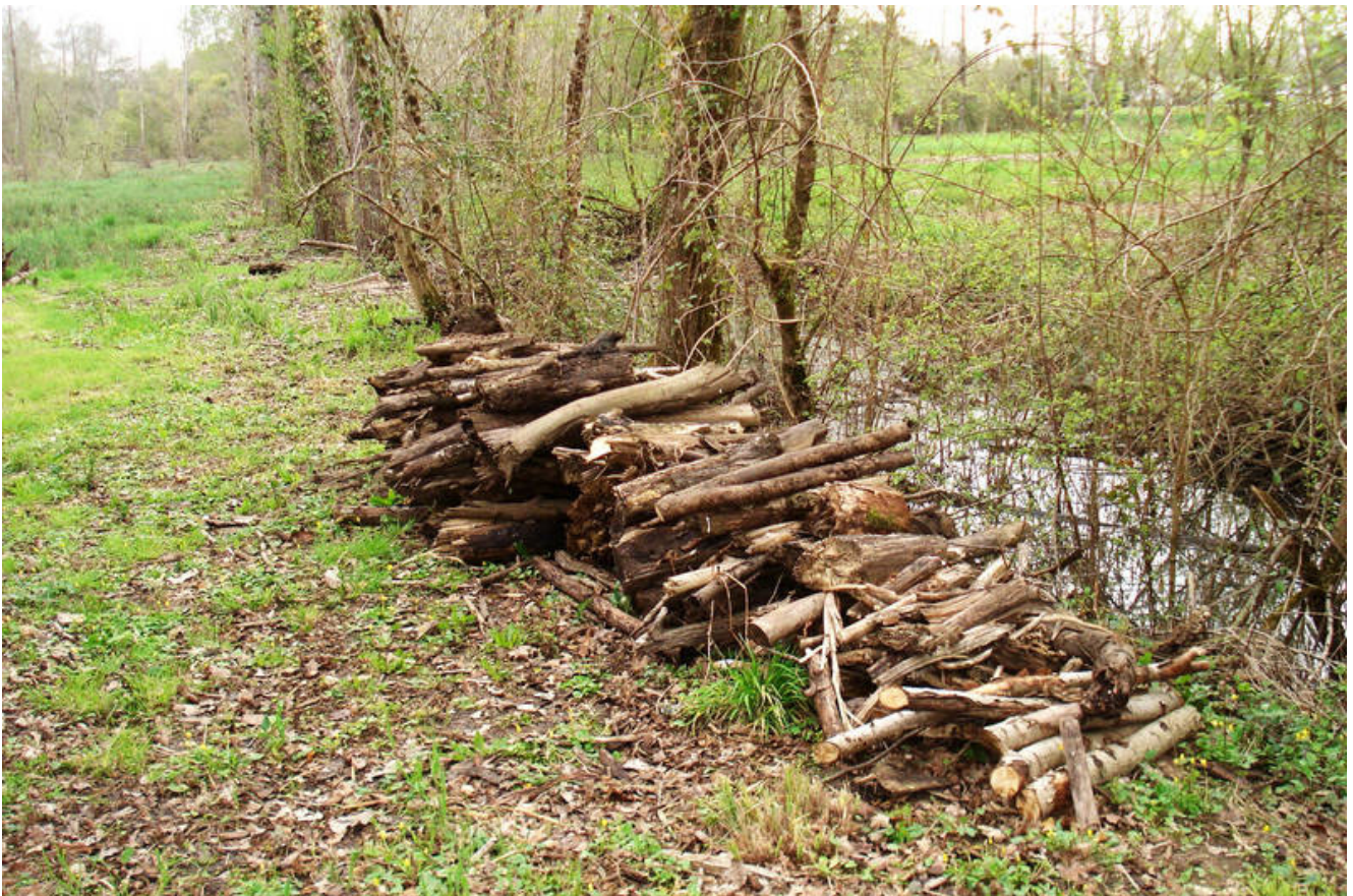
Hôtel à insecte