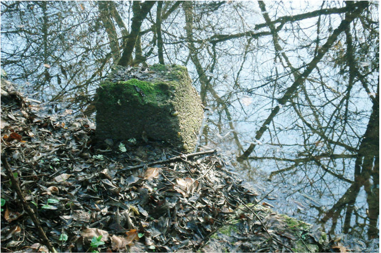
Vestige du lavoir