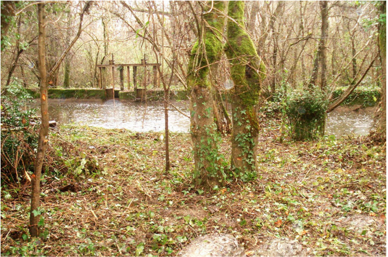
Les « pelles » et le quai