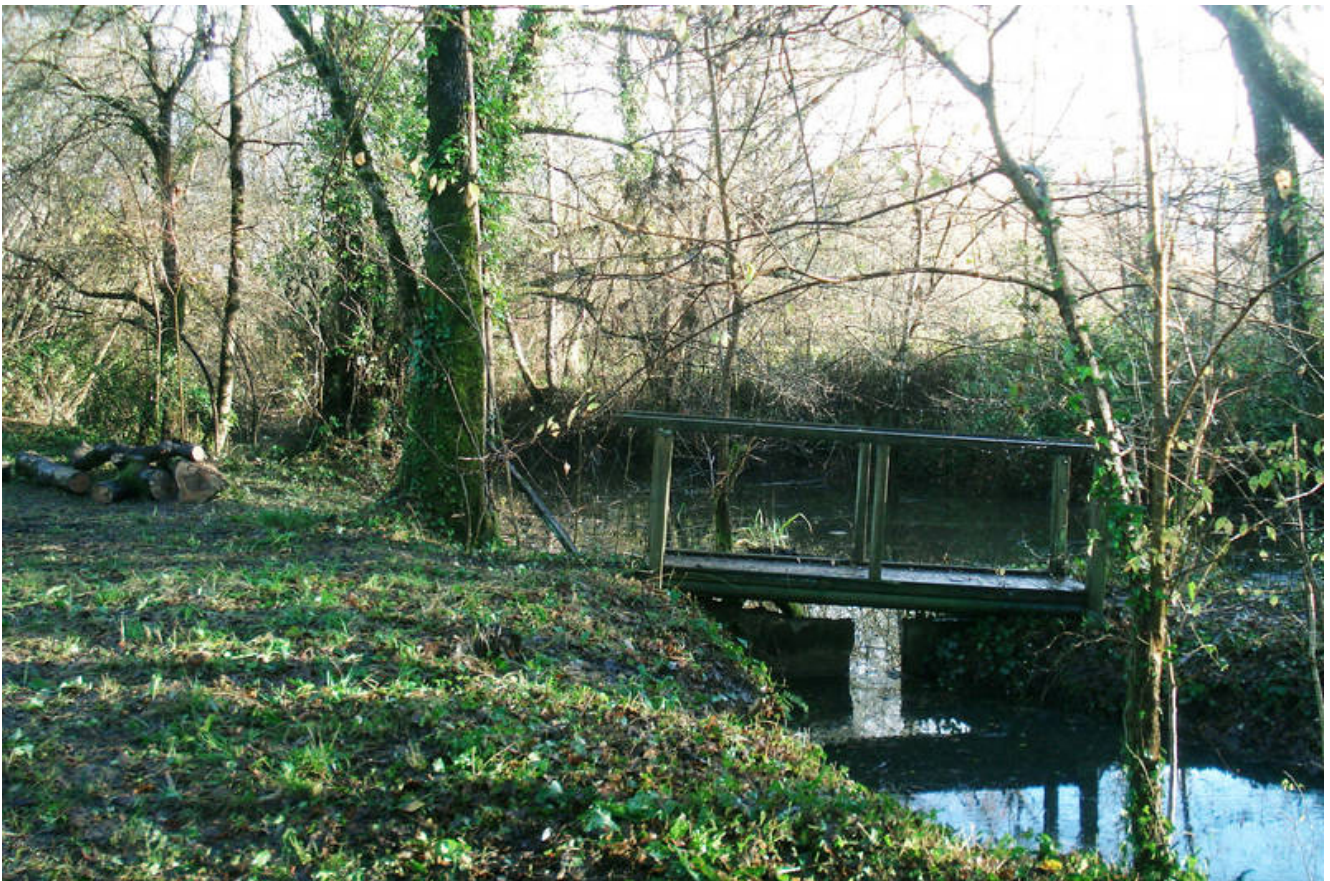
Passerelle en bois traversant la Rouille de Guzot